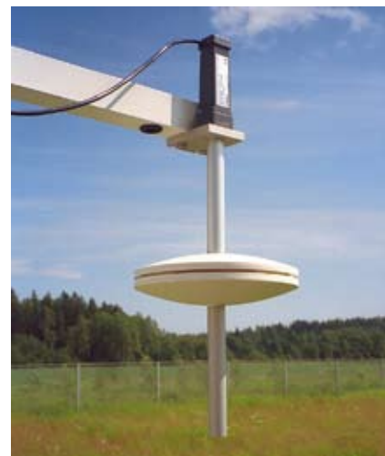
SPH10屋外気圧取入れ口(スタティック・プレッシャーヘッド)と組み合わせたPTB210

入れ口(スタティック・プレッシャーヘッド) SPH10/20シリーズと直接取付けることができます。この組み合わせにより、どんな風の条件でも精度の高い測定を実現します。