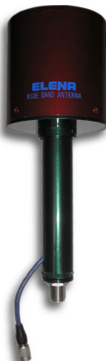
FHA7901A-001 (0.35kg) [NVLAP 標準校正]