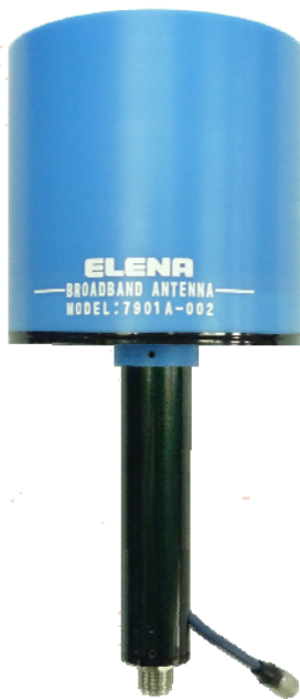
FHA7901A-002 (0.6kg) [NVLAP 標準校正]